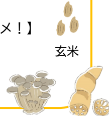
玄米 きのこと れんこん

詳しくは四日市市公式サイトにて・・・トップページ ライフメニュー〔健康・医療〕 →健康・医療・保健所→成人の健康づくり→必見！健康情報 ハ