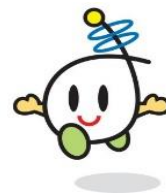
イメージキャラクター まなぼうや