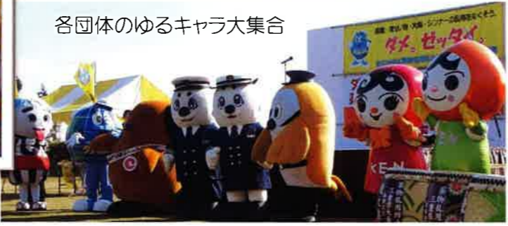
各団体のゆるキャラ大集合