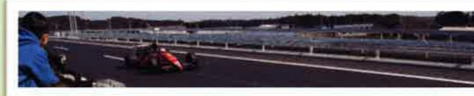
後日、F1カーが走行しました