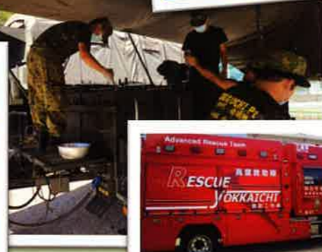
レスキューやヘリも来たよ!