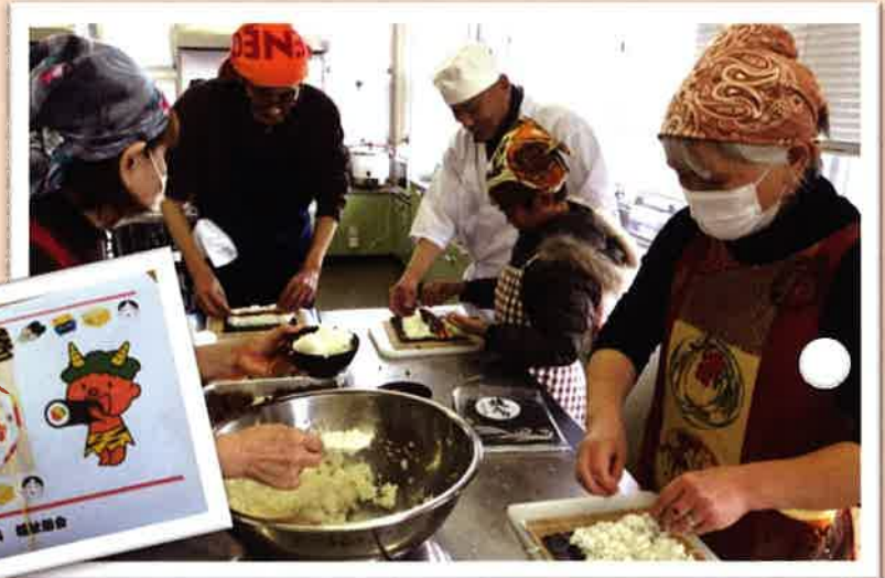
パッケージに入れて