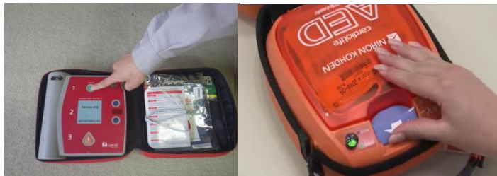
ボタンを押すタイプやふたを開けるタイプがあります