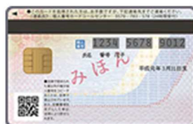
マイナンバーカード（裏面）

手間をかけて作るメリットはない、と思っていたのですが、立場上、家族のマイナンバーカードを昨年の春取得しました。