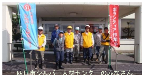
四日市シルバー人材センターのみなさん

6月9日(土)水沢地区の四日市シルバー人材センターのみなさんが、社会奉仕活動として、センター周辺と通学路などの草刈りをしていただきました。ありがとうございました。